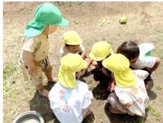
ミミズみーつけた!