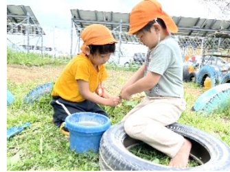
草相撲でいざ勝負!