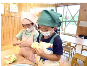
キャベツって柔らかいなあ