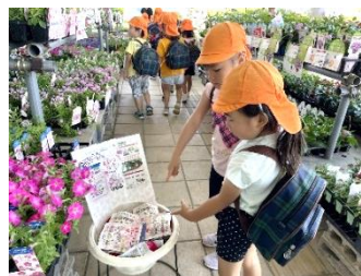
カンセキに買い物へ