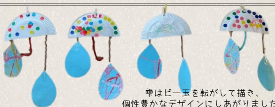
傘はビー玉を転がして描き、個性豊かなデザインに仕上がりました♪ くうさぎ組 2歳児