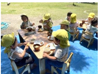
初めての外ランチ