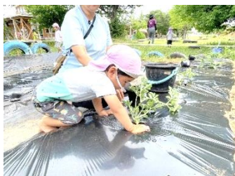
土をかけてギュッギュ!