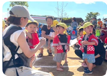
～昨年度の夏まつりの様子～

※事前に園からはっぴを貸し出します。 当日着用後は、ご家庭で洗濯・アイロン掛けをして返却をお願いします。